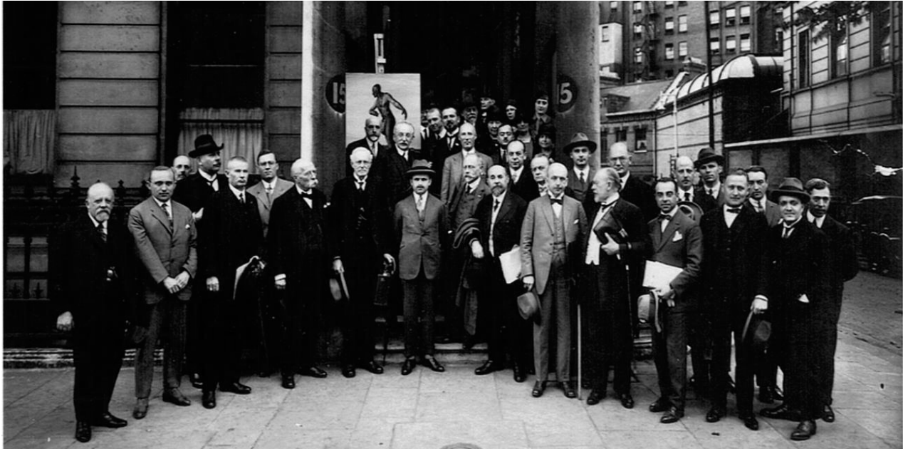
Vasile Stoica la o reuniune a Ligii Națiunilor