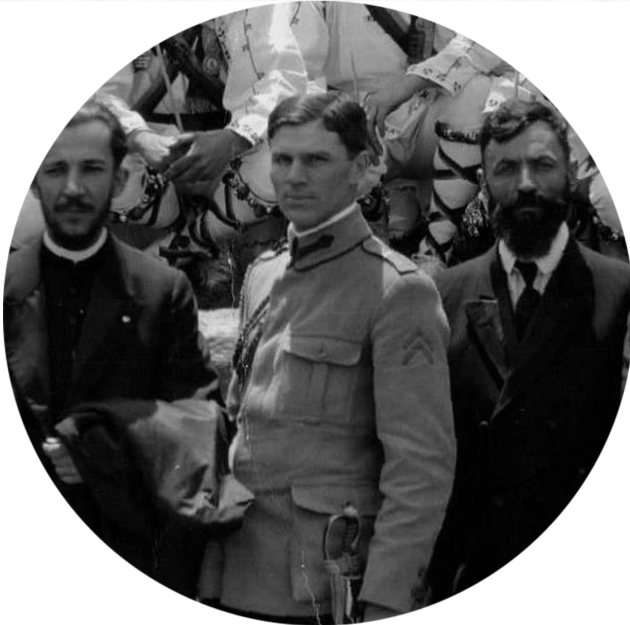
Gathering in Youngstown (July 5, 1918) The establishment of the National League of Romanians, president Vasile Stoica